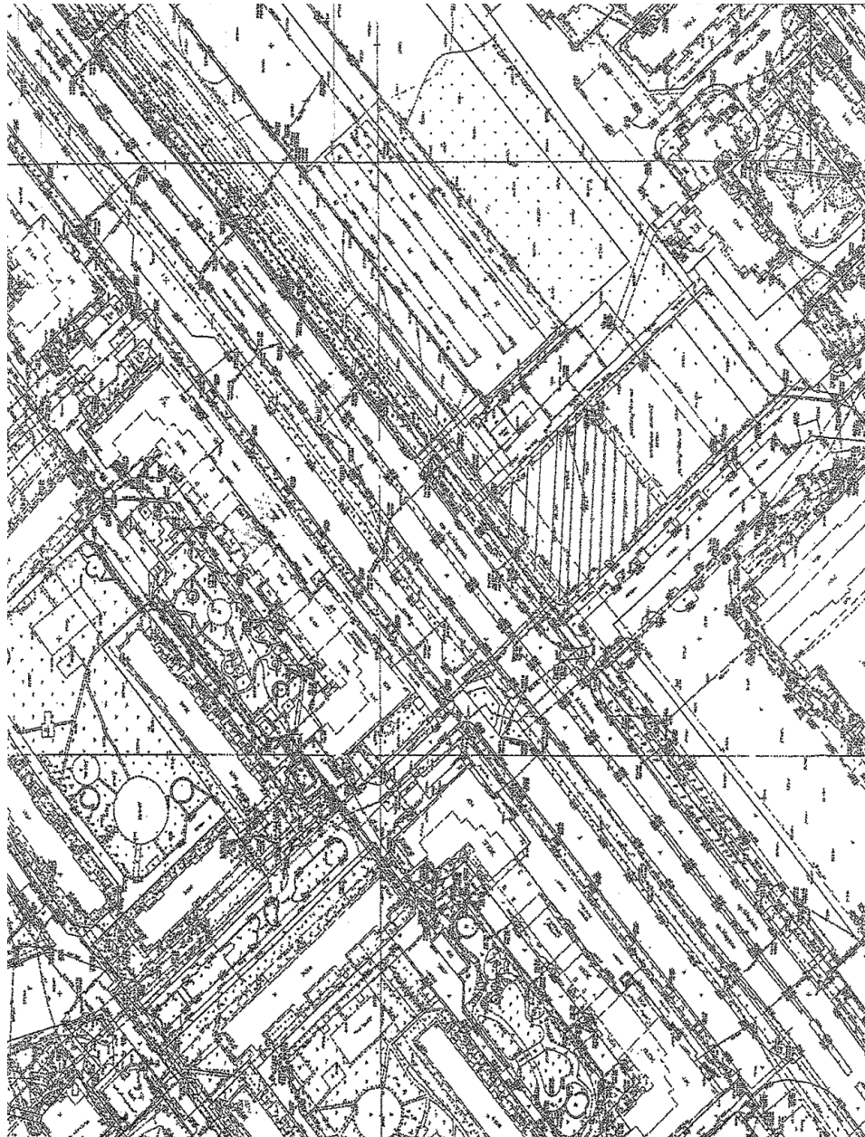
Приложение 2 к постановлению Администрации города от 14.12.2022 № 2843-п

Приложение 1 к постановлению Администрации города от 14.12.2022 № 2843-п